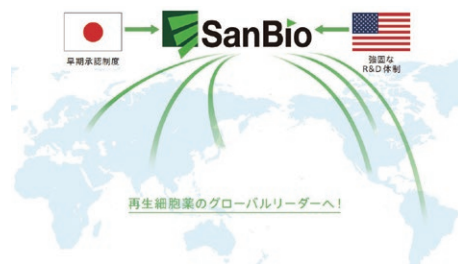
▲日本と米国の強みを活かした事業体制

再生細胞薬という全く新しい医療分野の創出を目指し、2001年に米国シリコンバレーでSanBio, Inc.を創業して以来、再生細胞薬の研究開発に取り組んできました。2014年の薬事法改正の動きに合わせて、日本法人サンバイオ株式会社を設立し、日米2極1体で事業を進めています。現在、製品化に向けて、日本、米国を含むグローバル規模でアンメットメディカルニーズのある疾患を対象に臨床試験を実施しています。