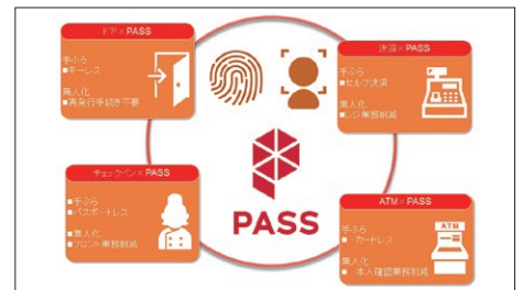
▲生体認証システム「PASS」の利用シーン

参加加盟店数は1000を超え、銀行ATM、オフィスビル、飲食店、宿泊施設、遊園地、ライブ会場など、幅広い業態で活用して頂いております。