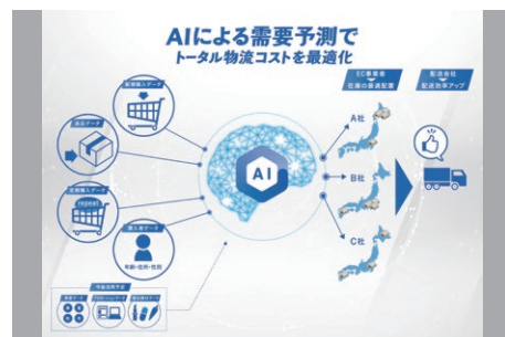
▲AI需要予測イメージ