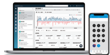
▲MiiTelにおける解析画面の一例