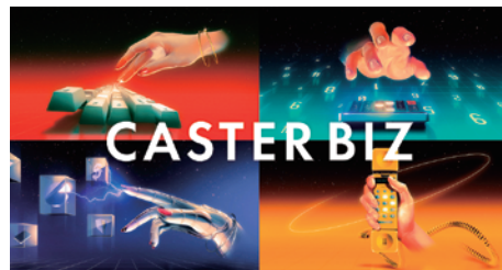
▲オンラインアシスタントサービス「CASTER BIZ」