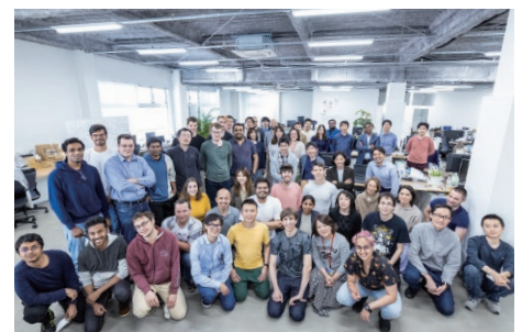
▲最上志向でエネルギッシュな仲間

当社は、チューリッヒ工科大学からスピノフしたベンチャー企業です。ロボティクスは、共通規格やプラットフォームがなく、非常に分断された産業であり、自動化率の低さが課題です。当社は公用語を英語にし、世界中から優秀なエンジニアを集め、世界最高峰の知見と技術力によって、ロボット制御の共通基盤を開発しました。