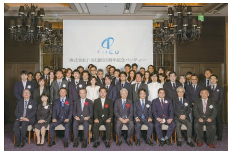
▲2021年10月で創立5周年を迎えました

遠隔相談システム『リリーヴ』は、全国的に専門家が不足する重症患者診療の現場を集中治療医・集中ケア認定看護師等で構成されたメディカルチームが24時間365日サポートします。また、離れた場所から患者と医療者に寄り添うことをコンセプトにした、遠隔モニタリングシステム『クロスバイ』を提供しています。